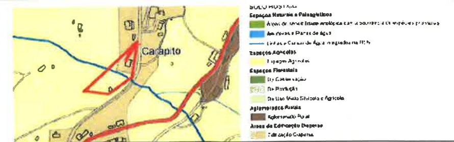
CARTA DE PDM - ORDENAMENTO - CINFÃES