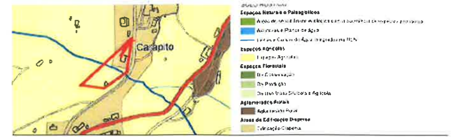
CARTA DE PDM – ORDENAMENTO – CINFÃES