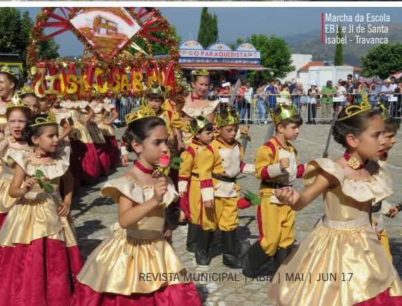
Marcha da Escola EB1 e II de Santa Isabel - Travanca