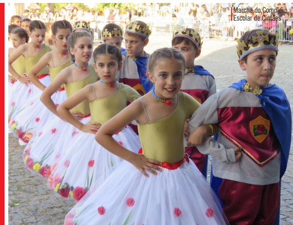
Marcha do Complexo Escolar de Cinfães

Obrigado pela participação, trabalho e dedicação e parabéns pelo magnífico espetáculo que deu um toque mágico e um colorido especial aos festejos São Joaninos em Cinfães.