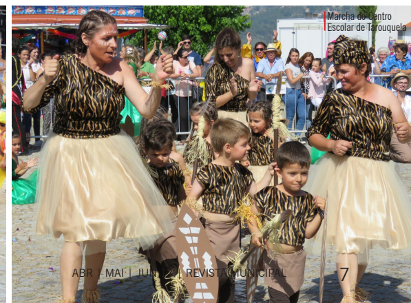
Marcha do Centro Escolar de Touroqueira