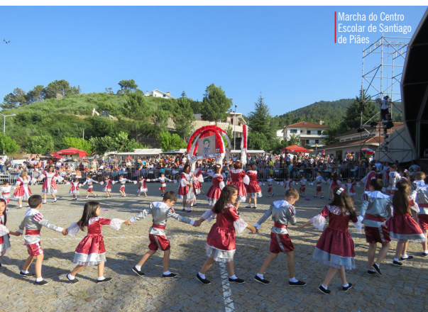
Marcha do Centro Escolar de Santiago de Piães