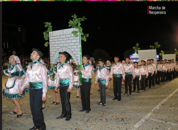
Marcha de Nespereira

rio Ardena, junto à Ponte da Balsa, esta marcha lembrou uma figura de outrora, quando as mulheres lavavam as roupas no rio e, ao mesmo tempo, carpiam mágoas, confidenciavam amores e desamores e espalhavam as novidades.