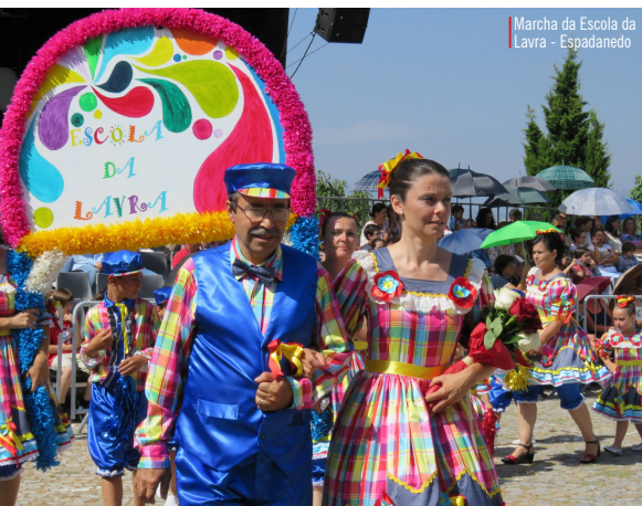
Marcha da Escola da Lavra - Espadanedo