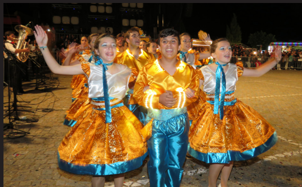
Marcha da Escola Secundária

20 anos da elevação de Souselo a vila foi o mote para este ano. “Souselo vila com história, povo com alma e coração” assim se apresentou esta marcha que, pelo meio da sua apresentação, decidiu batizar o presidente do Município, proporcionando um dos momentos mais engraçados da noite. “Os 30 anos de excelência na Educação” foi o tema seguinte trazido pela Escola Secundária de Cinfães. A marcha assinalou os 30 anos de serviço do estabelecimento de ensino. Com “orgulho” e “ vaidade”, alunos, professores e pessoal não docente dançaram com alegria, na noite de S. João. A encerrar a noite, o Grupo Folclórico de Nespereira apresentou “as lavadeiras do rio”. Recriando como cenário o