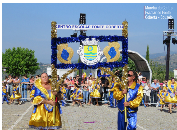
Marcha do Centro Escolar de Fonte Coberta - Souselo