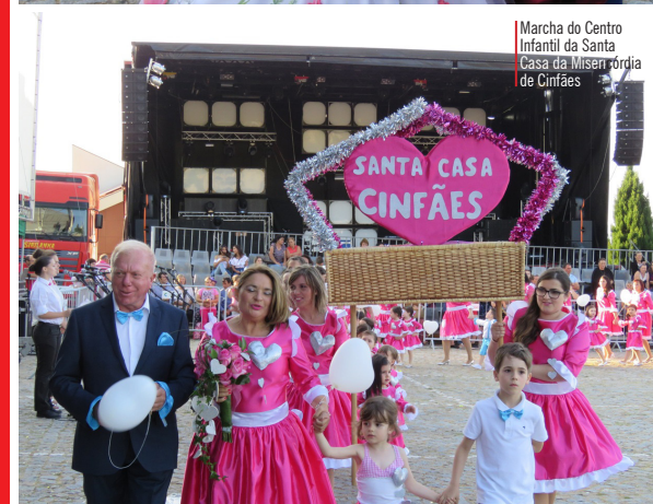
Marcha do Centro Infantil da Santa Casa da Misericórdia de Cinfães