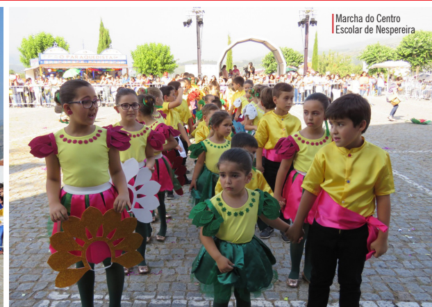
Marcha do Centro Escolar de Nespereira

Na tarde de 22 de junho, as marchas infantis saíram à rua dando um colorido especial às festas concelhias, em honra de S. João. Perto de 700 participantes desfilaram pelas ruas de Cinfães, rumo ao recinto das festas, para um espetáculo de cor, música, alegria e muita criatividade.