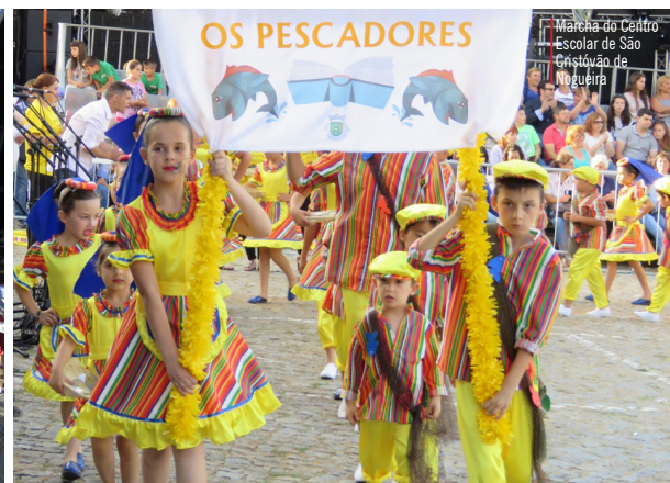
Marcha do Centro Escolar de São Cristóvão de Nogueira