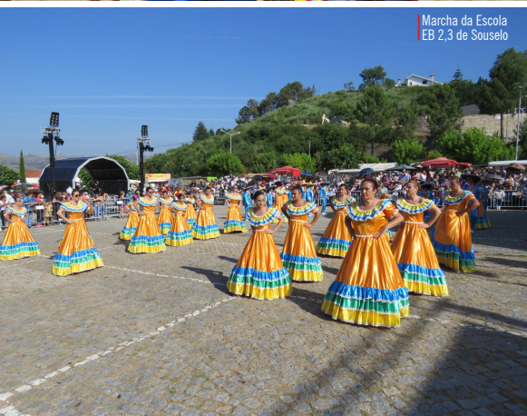
Marcha da Escola EB 2,3 de Souselo