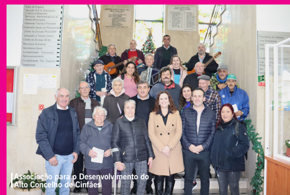
Associação para o Desenvolvimento do Alto Concelho de Cinfães