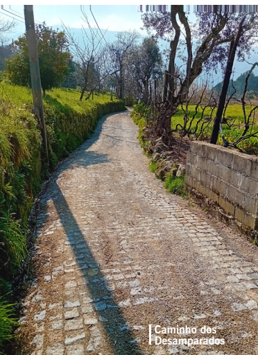
Caminho dos Desamparados