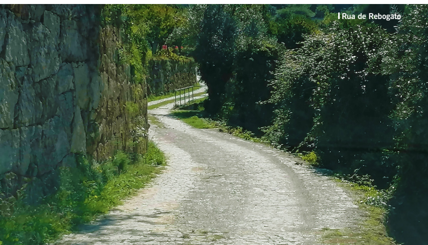
Rua de Rebogato

Esta intervenção veio melhorar as condições de circulação, automóvel e pedonal, dos moradores e demais utilizadores, permitindo também o acesso a viaturas de emergência.