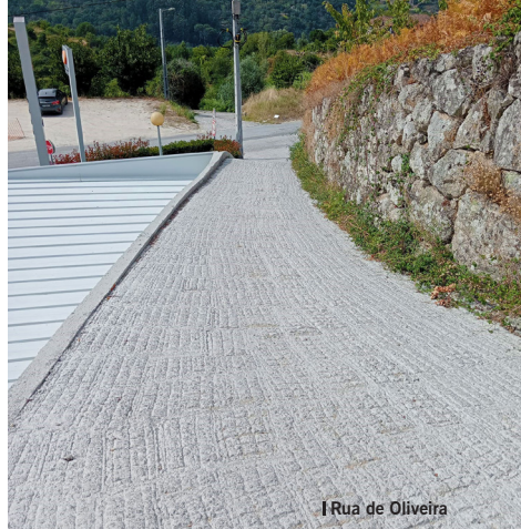
Rua de Oliveira