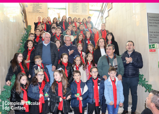
Complexo Escolar de Cinfães