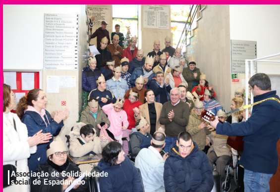
Associação de Solidariedade Social de Espadanedo