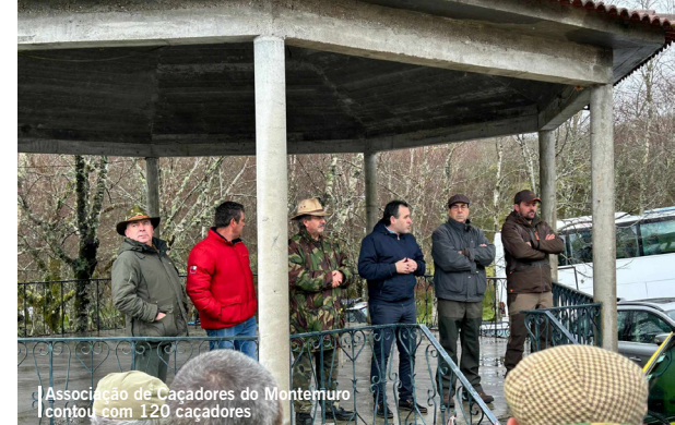
Associação de Caçadores do Montemuro contou com 120 caçadores