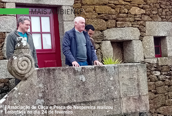
Associação de Caça e Pesca de Nespereira realizou montaria no dia 24 de fevereiro