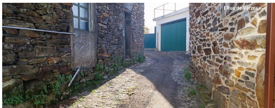
| Rua de Várzea