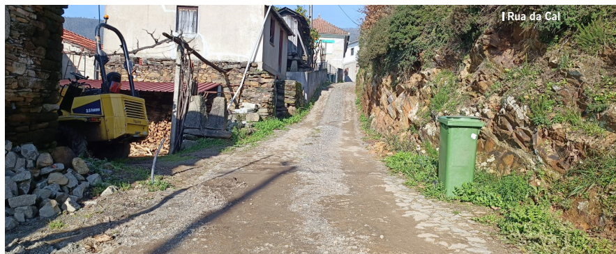
| Rua da Cal

Mais um investimento de proximidade. Não parámos!