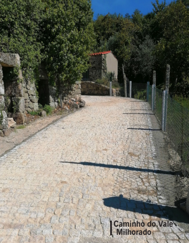
Caminho do Vale Milhorado