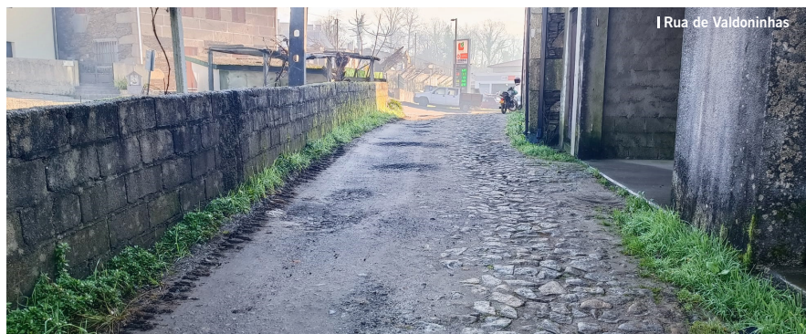
| Rua de Valdoninhas