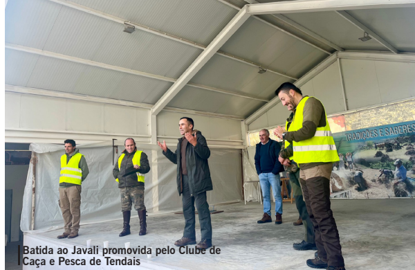
Batida ao javali promovida pelo Clube de Caça e Pesca de Tendais