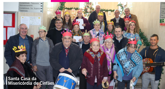
Santa Casa da Misericórdia de Cinfães

De sorrisos rasgados e com muito entusiasmo vieram cantar as Janeiras ao executivo e aos funcionários do Município. Acompanhados pelos professores das Atividades de Enriquecimento Curricular entoaram cânticos alusivos à época festiva, desejando um excelente ano novo para todos. OBRIGADA pela vossa presença e até ao próximo ano!