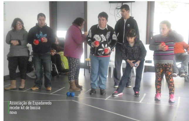
Associação de Espadanedo recebe kit de boccia novo